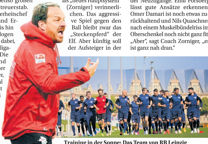
Training in der Sonne: Das Team von RB Leipzig

Offensive gefälliger und gefährlicher werden als in den letzten Wochen der Hinrunde mit nur zwei Treffern aus den letzten fünf Spielen. „Wir brauchen Lösungen im Spiel mit dem Ball“, sagt der Trainer. Grundvoraussetzung dafür ist die schnelle Integration der Neuzugänge. Emil Forsberg lässt gute Ansätze erkennen, Omer Damari ist noch etwas zurückhaltend und Nils Quaschner nach einem Muskelbündelriss im Oberschenkel noch nicht ganz fit. „Aber“, sagt Coach Zorniger, „er ist ganz nah dran.“