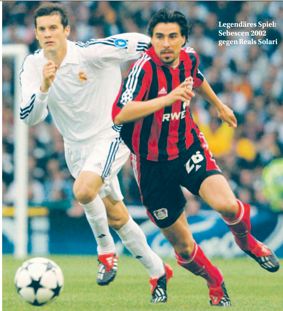
Legendäres Spiel: Sebesch 2002 gegen Real Solari

Wir waren zur Saisonvorbereitung in der Schweiz. Kaum zurück, schwoll mein Knie an. Wir gingen davon aus, dass dies eine Folge der Operation war. Ich musste wieder unters Messer. Nach sage und schreibe fünf weiteren Eingriffen in den nächsten 18 Monaten fand